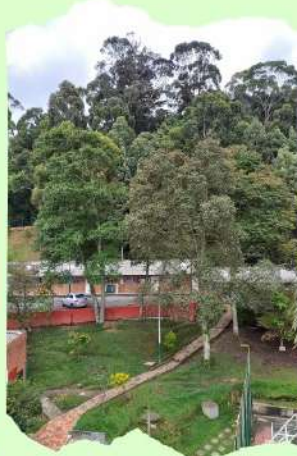
Facultad de Medio Ambiente y Recursos Naturales: Vivero