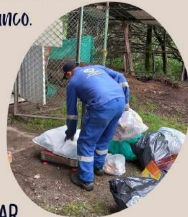
RECOLECCIÓN RESIDUOS APROVECHABLES ASODIG FACULTAD DE MEDIO AMBIENTE Y RECURSOS NATURALES - VIVERO