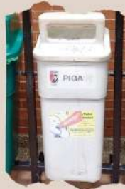
PUNTO ECOLÓGICO ZONAS COMUNES